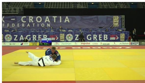
Slika št. 2 NI waza-ri , pade na prednjo stran telesa