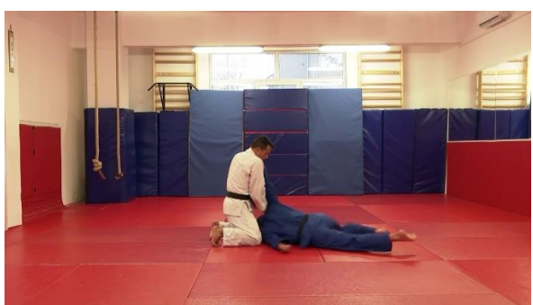
Slika št. 4 NI waza-ari , pade na prednjo stran telesa