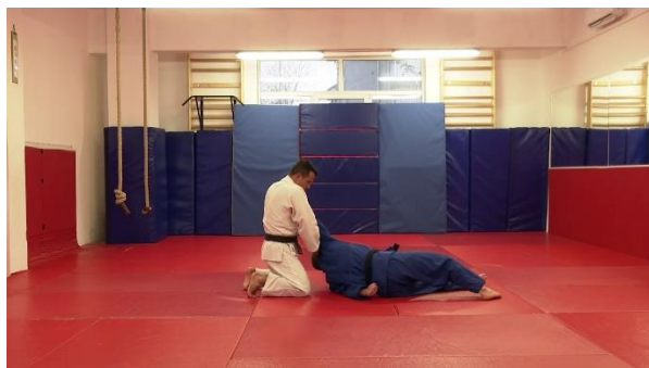
Slika št. 3 waza-ari , kljub komolcu zunaj