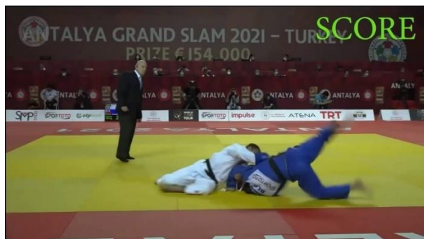
Slika št. 5 waza-ari padec na eno ramo in zgornji del hrbta

Tehnika se točkuje z waza-ari, če tekmovalec pade po celi strani telesa pod kotom 90 stopinj ali manj v smeri hrbta ali če pade na eno ramo in zgornji del hrbta. Tehnika se točkuje, če tekmovalec pade po celi strani telesa, tudi če ima komolec na zunanji strani telesa.