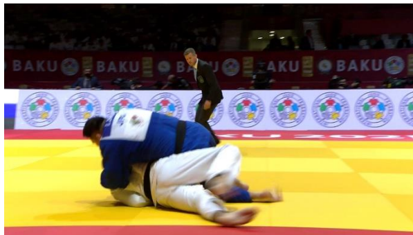
Slika št. 1 waza-ari , padec na stran

Tehnika se točkuje z waza-ari, če tekmovalec pade po celi strani telesa pod kotom 90 stopinj ali manj v smeri hrbta ali če pade na eno ramo in zgornji del hrbta. Tehnika se točkuje, če tekmovalec pade po celi strani telesa, tudi če ima komolec na zunanji strani telesa. Upoštevati je potrebno položaj bokov in ramen pri padcu.