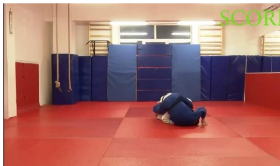
Slika št. 6 waza-ari padec na eno ramo in zgornji del hrbta